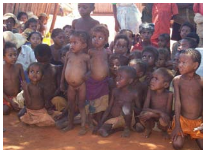
février 2007