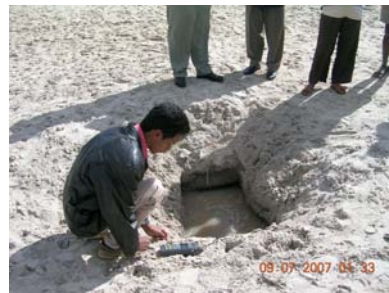
Un « puits traditionnel » dans la commune de Beloha - photo SoaMad - juillet 2007

La région Androy, dans l'Extrême-Sud de Madagascar, connaît un climat semi-aride marqué par une faible pluviométrie (350 à 600 mm/an) et une forte irrégularité inter-annuelle. Des épisodes récurrents de kéré (disette, famine) surviennent dans la région dès que la pluviométrie baisse par rapport à la moyenne déjà faible. Le kéré de juin 2006 à février 2007 a été particulièrement désastreux.