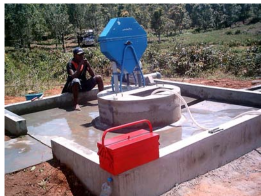
Le puits muni d'une pompe manuelle qui sera construit dans les villages

Eau potable disponible au village : réduction des maladies diarrhéiques et d'origine hydrique, éducation à l'hygiène et assainissement, mais aussi, sensibilisation à l'économie et à la conservation de l'eau, à la préservation de l'environnement.